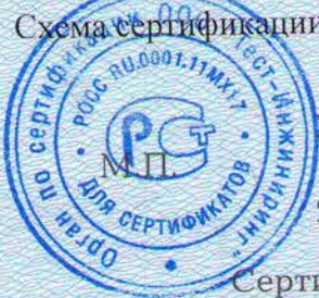
Схема сертификации: За.

Место нанесения знака соответствия: на сопроводительной технической документации.